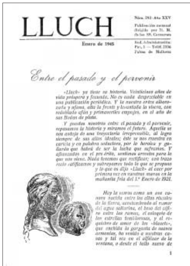
Portada del núm. 293. Gener 1945

Les principals fonts per tenir un coneixement sumari de la revista són els treballs següents: